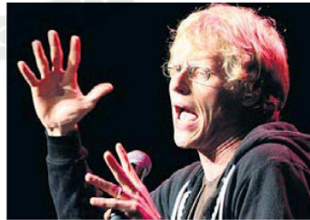
Une anecdote signée Simon Leblanc promet de sortir du lot.